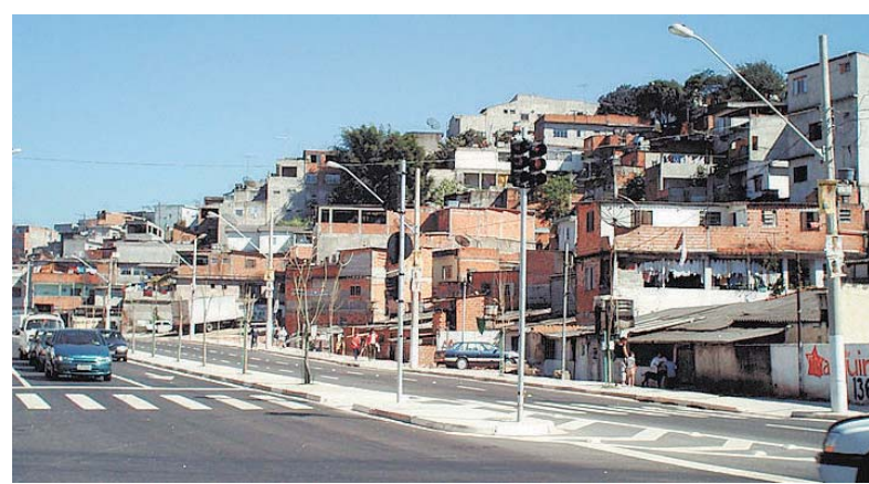
ANTES E DEPOIS – Córrego canalizado e avenida no núcleo Vera Cruz

tação (Labhab) da USP. O grande adensamento da cidade se deve ao crescimento desordenado de loteamentos irregulares nas décadas de 70 e 80. Hoje, Diadema tem a segunda maior densidade demográfica do País, com 12,3 mil habitan-