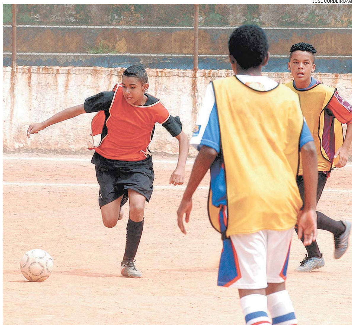
FUTEBOL – Cerca de 4 mil crianças e adolescentes frequentam escolinhas gratuitas do Diadema 21

Aproximar a comunidade da escola é outra estratégia da prefeitura. Os pais dos alunos elegem o diretor, participam da elaboração do plano pedagógico e conferem o balanço anual